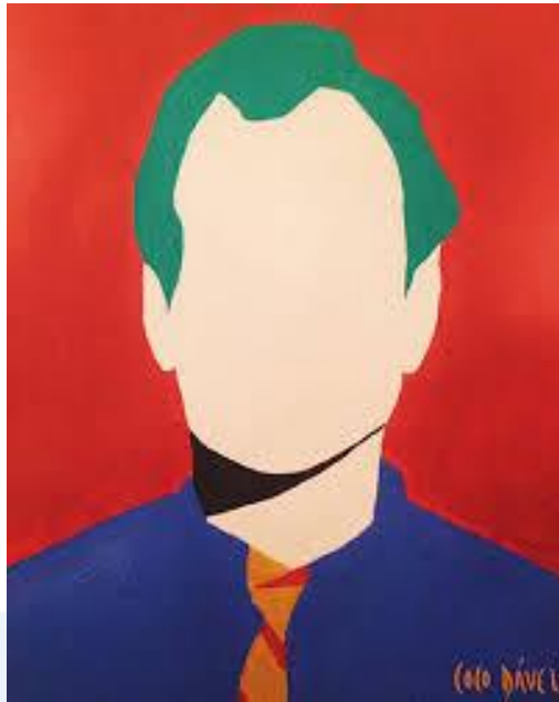
Revisor de avalúos